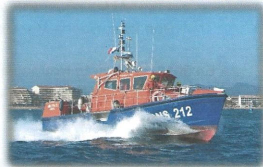
VELETTE DE LA STATION ESTEREL